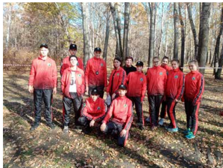
Финальные соревнования по легкоатлетическому кроссу в зачет областной Спартакиады среди ПОО Свердловской области — 4 место