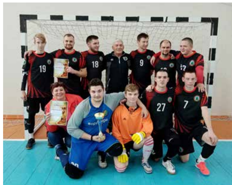
Сборная по футболу 2021, Кубок открытия — 1 место