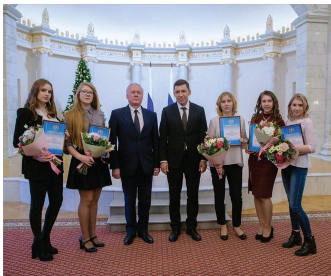
Вручение стипендии Губернатора Свердловской области в культурно-выставочном комплексе «Синара Центр». г. Екатеринбург. 2019 г.