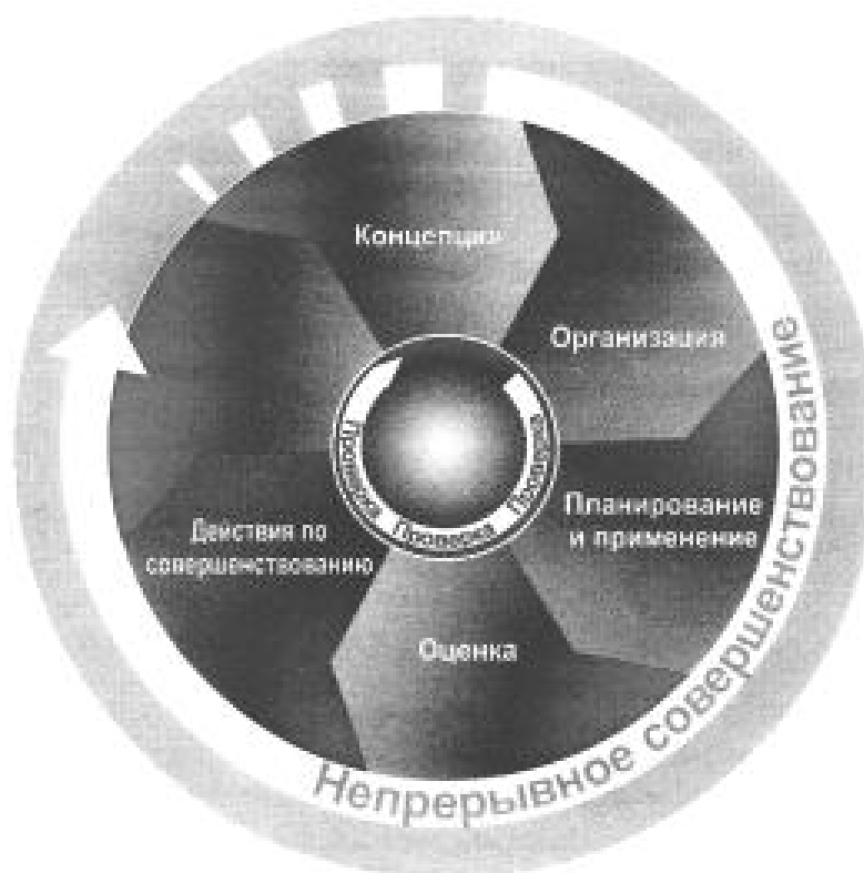
Рис. 1. Модель Системы управления охраной труда (СУОТ).

Согласно системы стандартов безопасности труда - ГОСТ Р 12.0.007-2009 СУОТ предусматривает последовательность выполнения функций управления