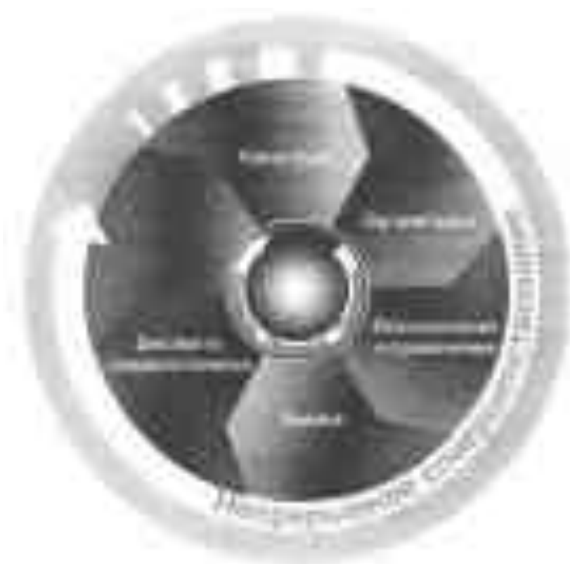
Рис. 1. Модель Системы управления охраной труда (СУОТ).

Согласно системы стандартов безопасности труда - ГОСТ Р 12.0.007-2009 СОУТ предусматривает последовательность выполнения функций управления